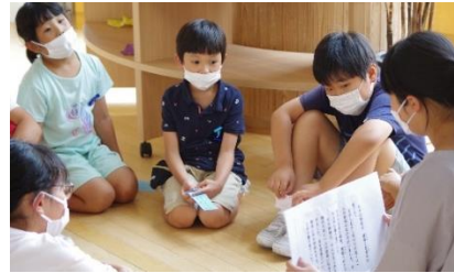
左1)七夕集会 読み聞かせ