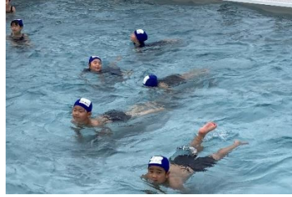
左1)職員不審者 対応訓練