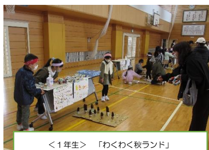
<1年生> 「わくわく秋ランド」秋のものでおもちゃを作って遊びました。