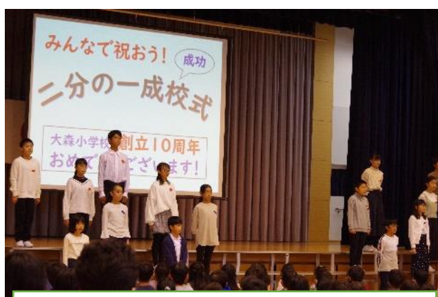
スマイルプロジェクト委員の発表