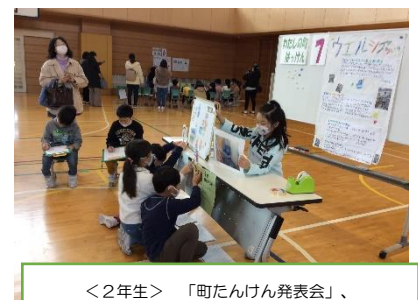
<2年生> 「町たんけん発表会」、新聞やペープサートなどで発表しました。