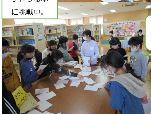
手作り絵本を作ってみようよ