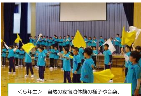
<5年生> 自然の家宿泊体験の様子や音楽、フラッグ演技、外国語学習の発表をしました。

今年はコロナ禍のため、全校生での学習発表会は中止しましたが、各学年での学習の成果を適時発表しています。制限はありますが、お家の方にも観に来ていただいています。スタートは5年生、その後1年生と2年生が行いました。12月には3年生、6年生が予定されています。