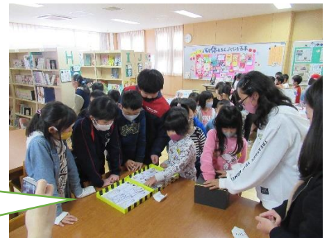
くじを引いて当たると、プラス1冊券やしおりがもらえる