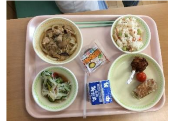
うどん、ちらし寿司、麩ロシキ、チキン、サラダなどから選びます。