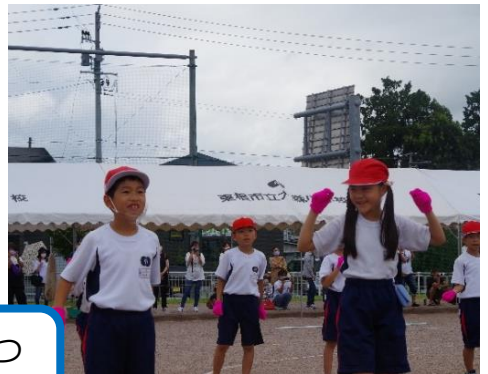
実行委員長の堂々としたあいさつ 「思い出に残る運動会を創ろう」