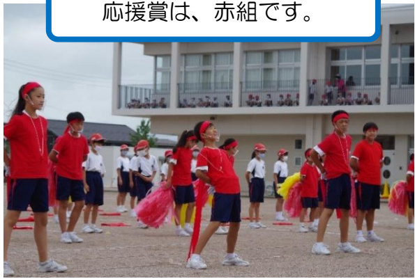
応援賞は、赤組です。