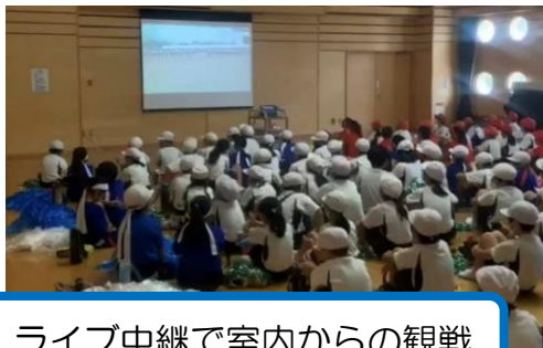
ライブ中継で室内からの観戦