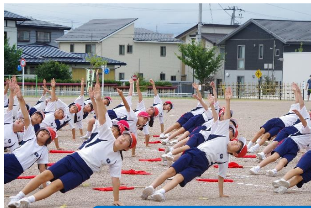
みんなが揃った演技に、拍手