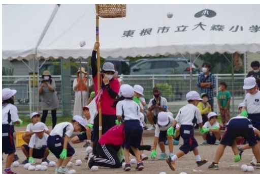
力を合わせて、もう一息