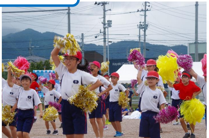
かわいさ100点、笑顔満点。♡