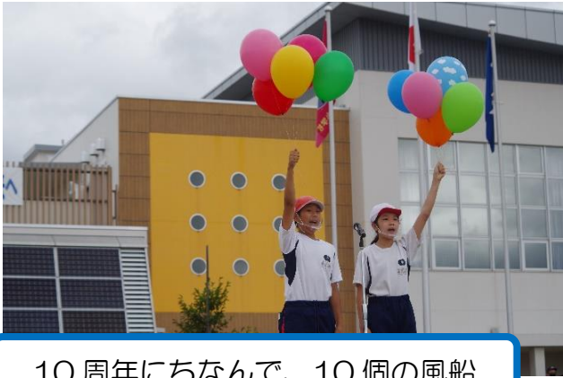
10周年にちなんで、10個の風船