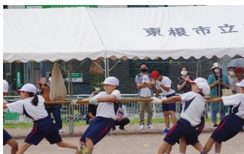
赤も白も、がんばれー